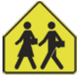
P-265-G DÉBUT D'UNE ZONE SCOLAIRE 60 X 60