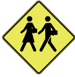
D-270-1-D SIGNAL AVANCÉ D'UNE ZONE SCOLAIRE 60 X 60