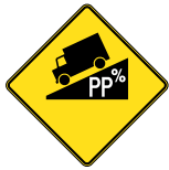
D-230-1 PENTE RAIDE 60 X 60