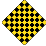
D-280 FIN D'UNE VOIE OU D'UN CHEMIN 60 X 60