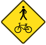
D-270-6-D SIGNAL AVANCÉ DE PASSAGE POUR PIÉTONS ET CYCLISTES 60 X 60