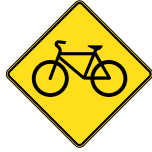
D-270-7-D SIGNAL AVANCÉ DE PASSAGE POUR BICYCLETTES 60 X 60