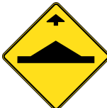
D-361 SIGNAL AVANCÉ DE DOS D'ÂNE 60 X 60