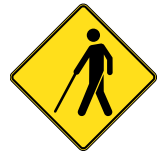
D-270-5-D SIGNAL AVANCÉ D'UN PASSAGE POUR PERSONNES ATTEINTES DE DÉFICIENCE VISUELLE 60 X 60