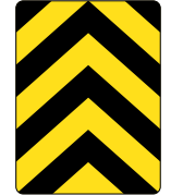
D-290 BALISE A CHEVRON 60 X 90