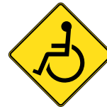
D-270-4-D SIGNAL AVANCÉ D'UN PASSAGE POUR PERSONNES ATTEINTES DE DÉFICIENCE PHYSIQUE 60 X 60