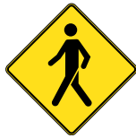
D-270-2-D SIGNAL AVANCÉ DE PASSAGE POUR PIÉTONS 60 X 60