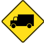
D-270-11-D SIGNAL AVANCÉ DE PASSAGE POUR VÉHICULES LOURDS 60 X 60