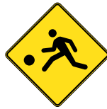
D-270-3-D SIGNAL AVANCÉ DE PASSAGE POUR ENFANTS PRÈS D'UN TERRAIN DE JEU 60 X 60