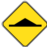
D-361 DOS D'ÂNE 60 X 60