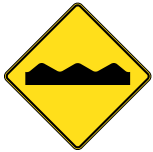
D-360 CHAUSSEE CAHOTEUSE 60 X 60